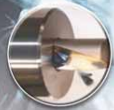
Drilling ( \phi 8.0\text{mm} - \phi 32.0\text{mm} )